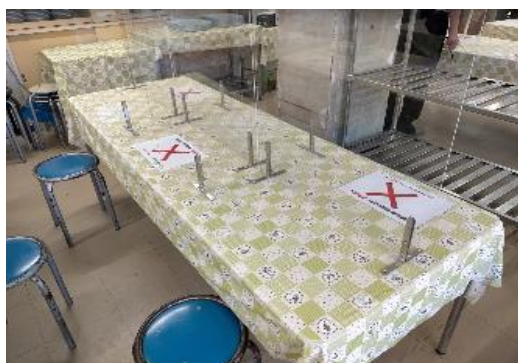
食堂のテーブル（パーティション設置）