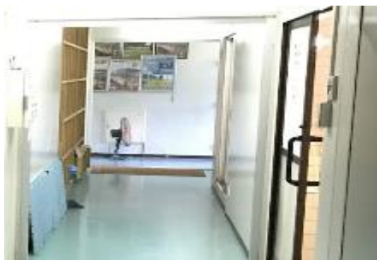
脱衣所（奥にサーキュレーター）